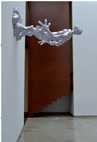
Bernard QUESNIAUX, La question du socle #2 , 2010 fibre de verre, résine, laque, chien empaillé Collection Frac Basse-Normandie

« Alors s'assit sur un monde en ruines une jeunesse soucieuse », est la citation - extraite de La Confession d'un enfant du siècle d'Alfred de Musset (1836) - qui constitue le fil rouge de cet accrochage et dont la portée reste aujourd'hui étonnamment vive. Esthétique de la désolation, scènes de déploration revisitées, réalité crue ou rêverie poétique, les œuvres choisies dans les collections du musée des Beaux-Arts de Caen et du Frac Basse-Normandie témoignent d'une vision désenchantée du monde. Les artistes d'aujourd'hui interrogent la société post-moderne dans une forme de rumination inquiète mais également attentive à la moindre lueur. Pour cette première édition, le musée des Beaux-Arts et le Frac mêlent une cinquantaine d'œuvres issues de leurs collections : Didier Ben Loulou, Philippe Borderieux, François Curlet, Olivier Debré, Noël Dolla, Leo Fabrizio, Dominique Figarella, Gloria Friedmann, Monique Frydman, Denis Laget, Micha Laury, Yveline Lecuyer, Joan Mitchell, Zoran Music, Bernard Quesniaux, Judith Reigl, Paul Rebeyrolle, Sophie Ristelhueber, Bruno Serralongue.