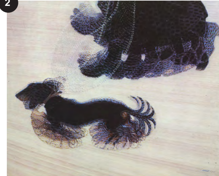
Balla Dynamisme d'un chien en laisse 1912.