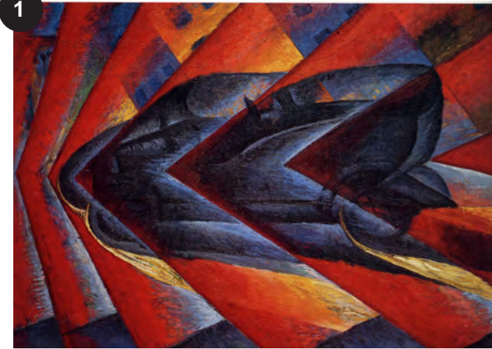
Russolo, Dynamisme d'une automobile , 1912.