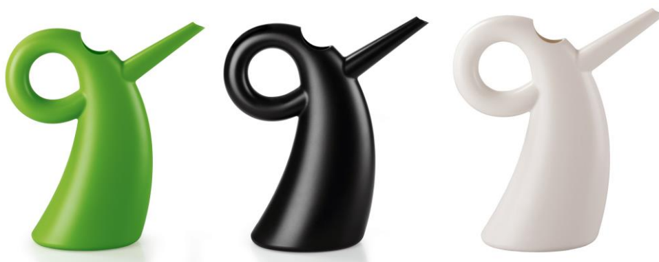
2. Eero AARNIO , arrosoir Diva , 2011 éditeur Alessi, résine thermoplastique, 150cl, L 280 X l 108 X h 310 mm