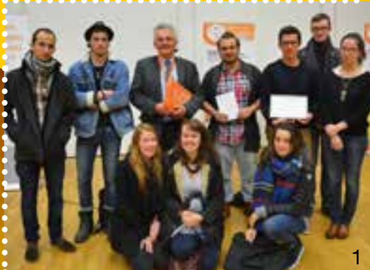
BTS design de produits - 2 e année