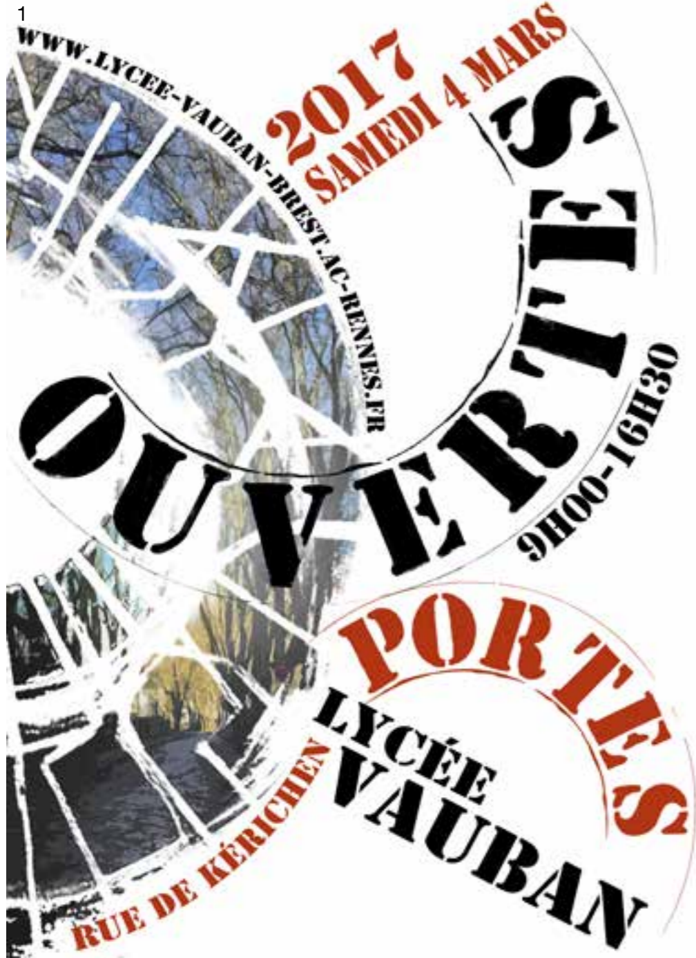
Bac STD2A - Premières