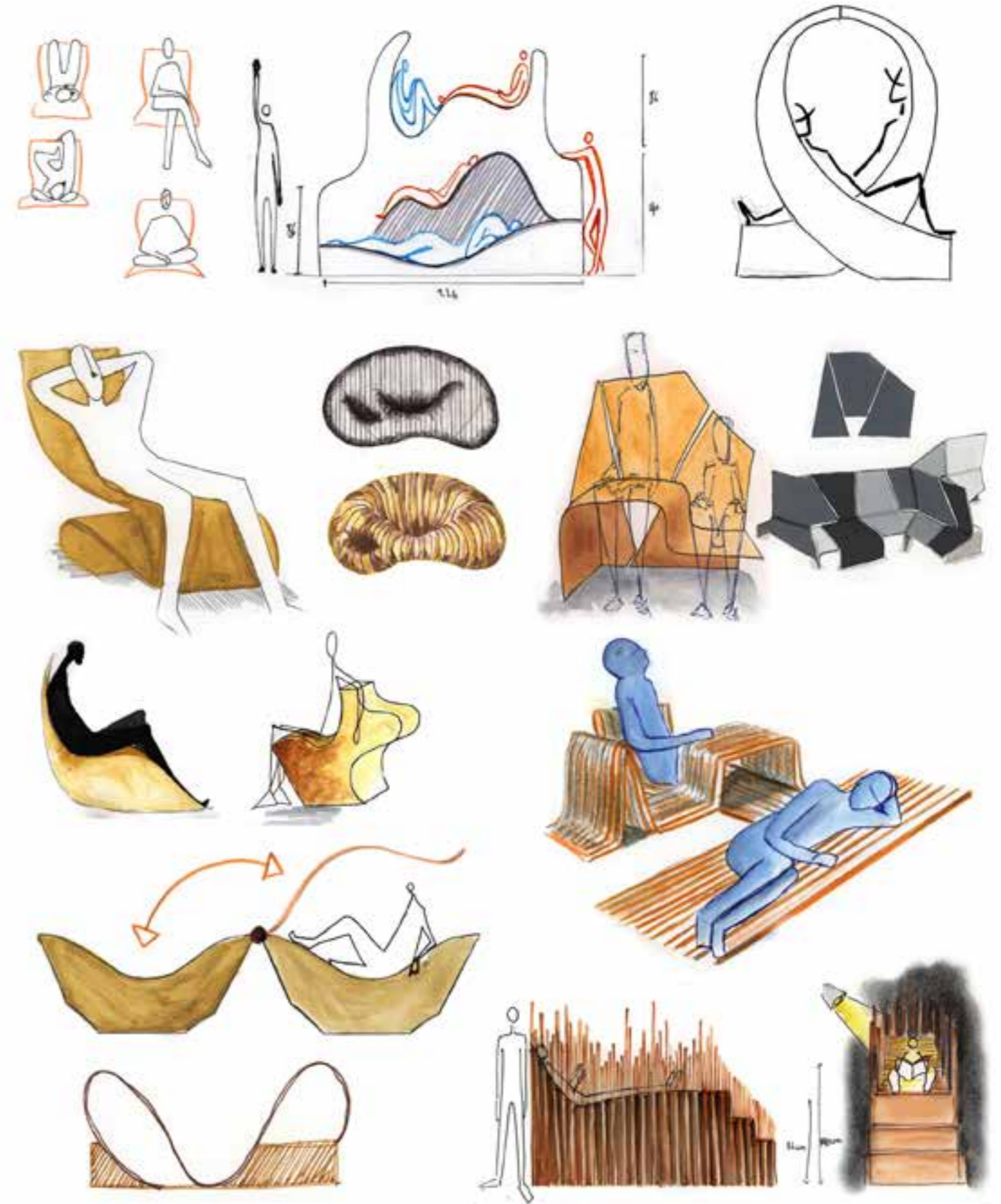
Bac STD2A - Terminales