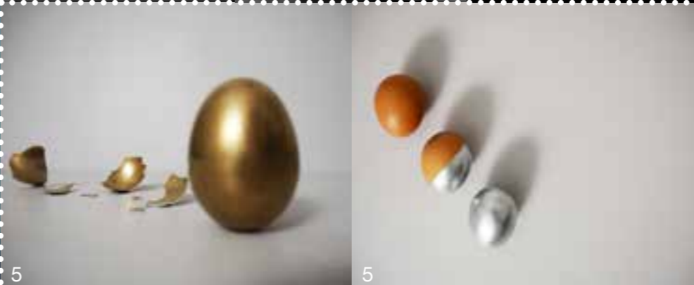
BTS design de produits - 1 re et 2 e année