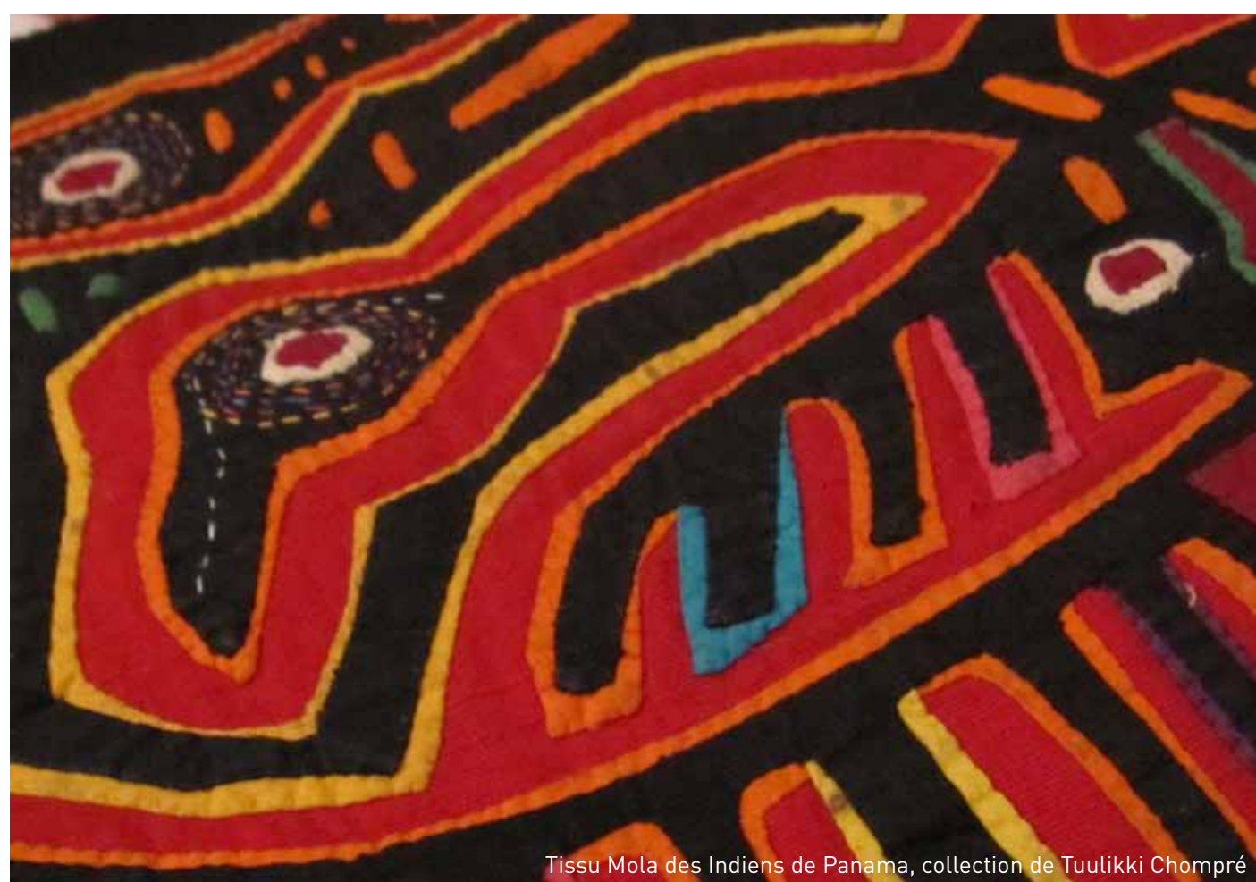
Tissu Mola des Indiens de Panama, collection de Tuulikki Chompré