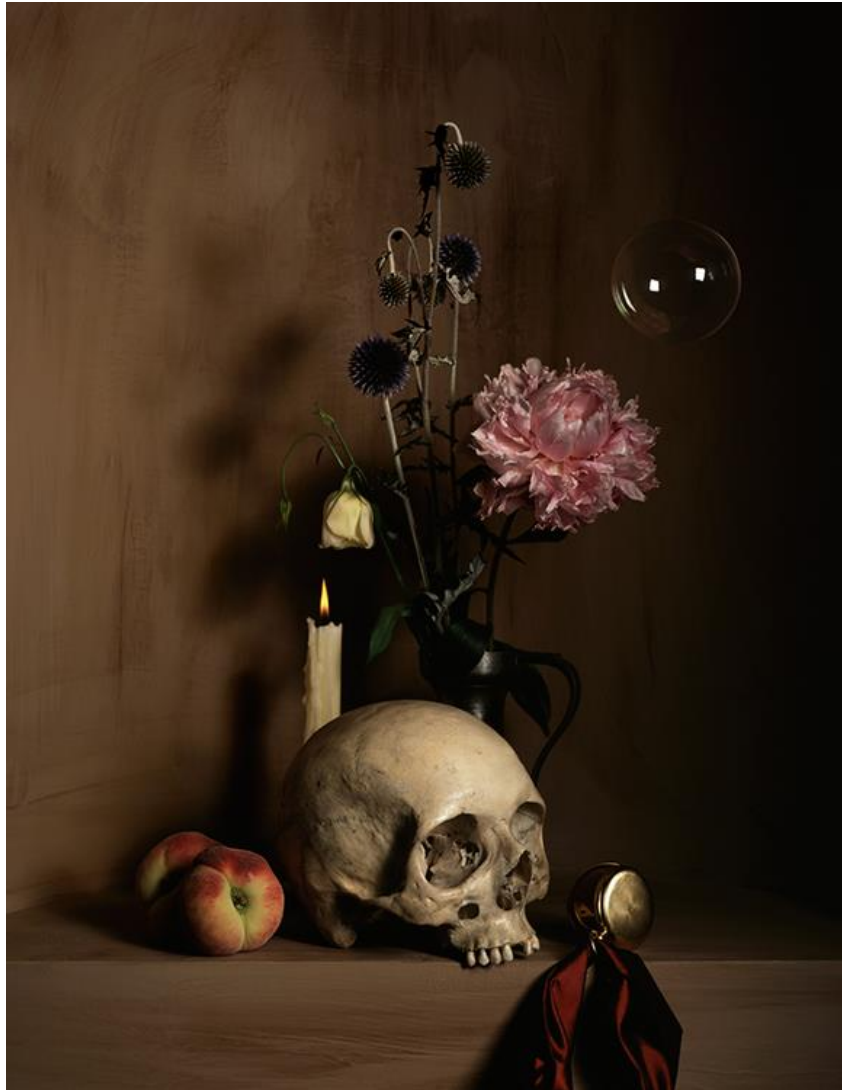
MOCAFICO Guido, Nature morte à la vanité , 2007