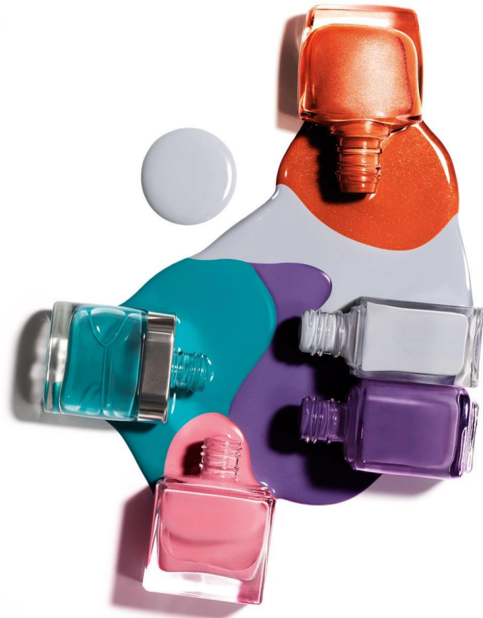
BENOIT Sylvie, extrait du portfolio Still life two (Nature morte 2) , non daté