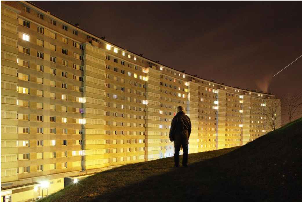
CORNUT Cyrus, Cité Champagne , Argenteuil, 2010