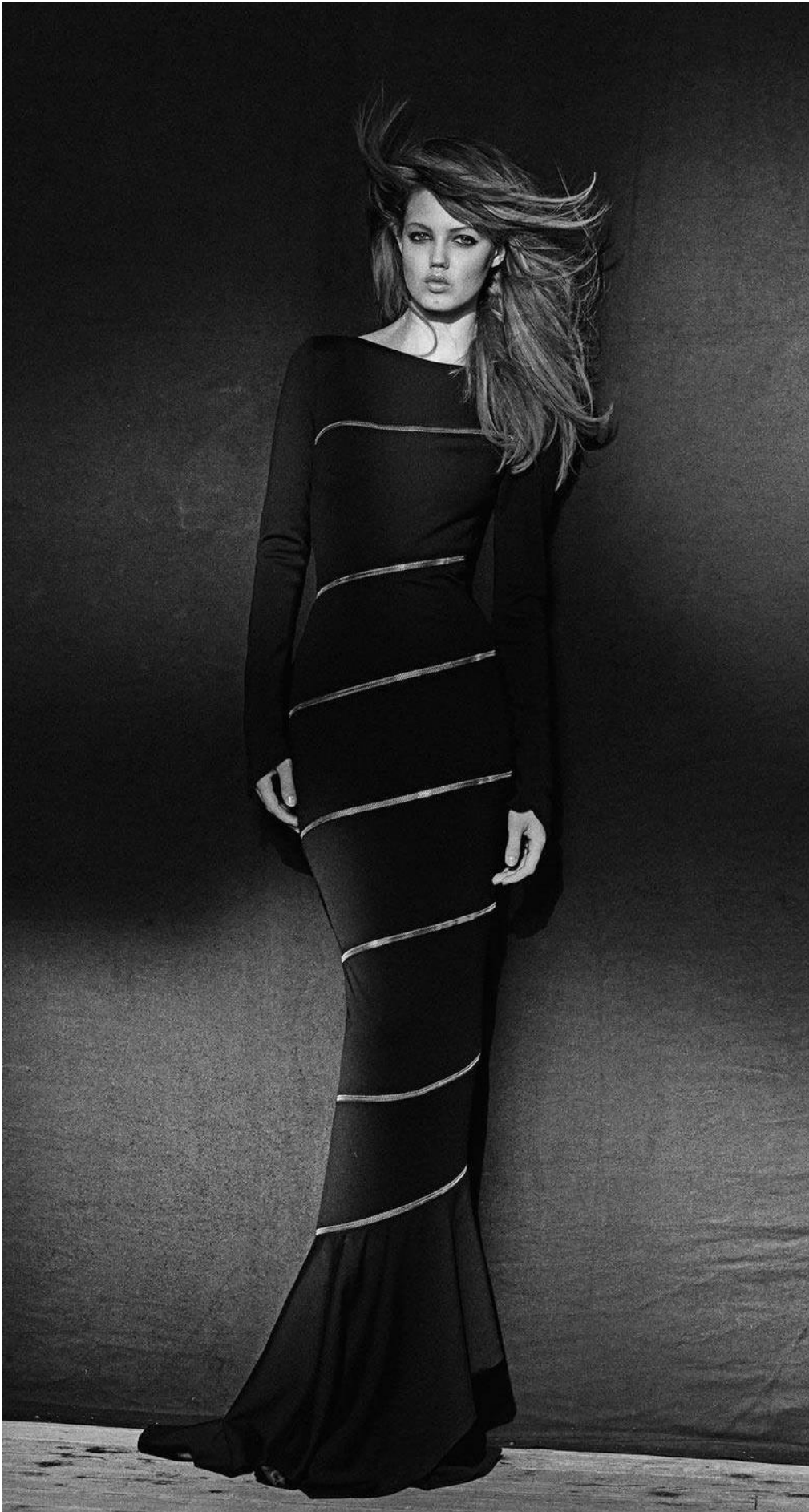
Azzedine ALAÏA , couturier, robe longue en jersey de laine noire et fermeture à glissière métallique, collection couture printemps 2003.