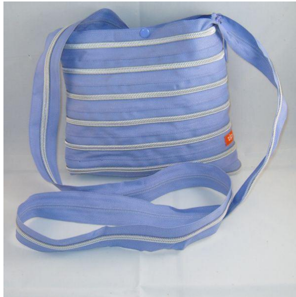
Zipit Fling , sac à main constituée par une seule fermeture à glissière, années 2010.