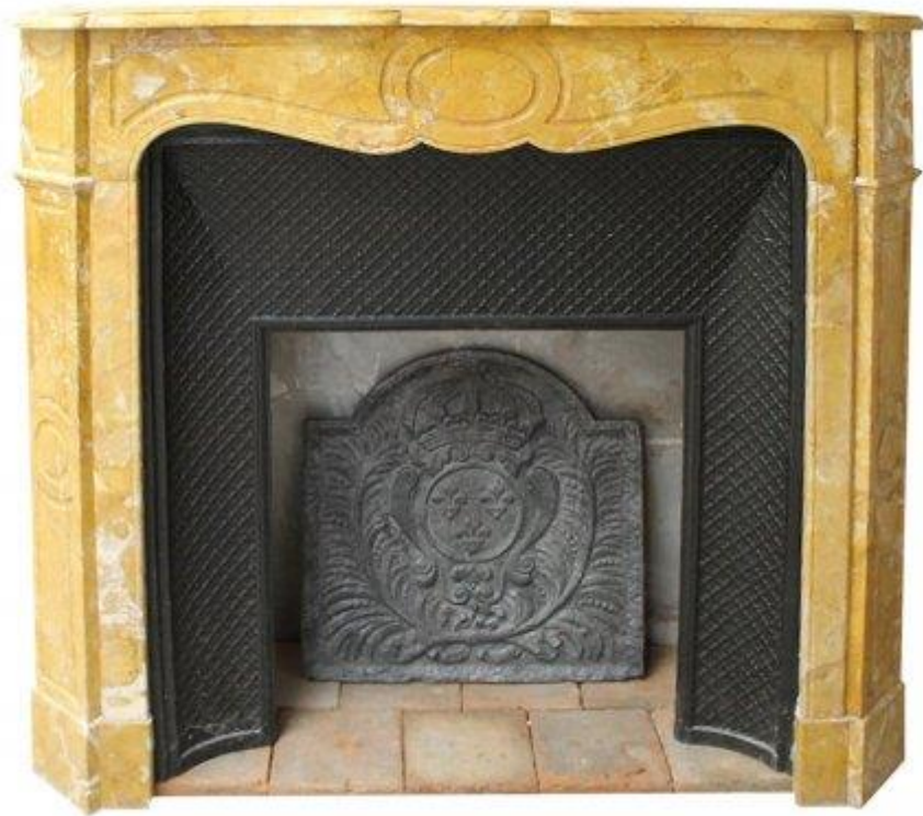
Cheminée fin XIX e siècle en marbre jaune de Sienne.