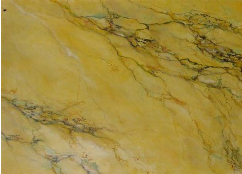
Marbre jaune de Sienne, carrière de Montarrenti, commune de Sovicille près de Sienne.