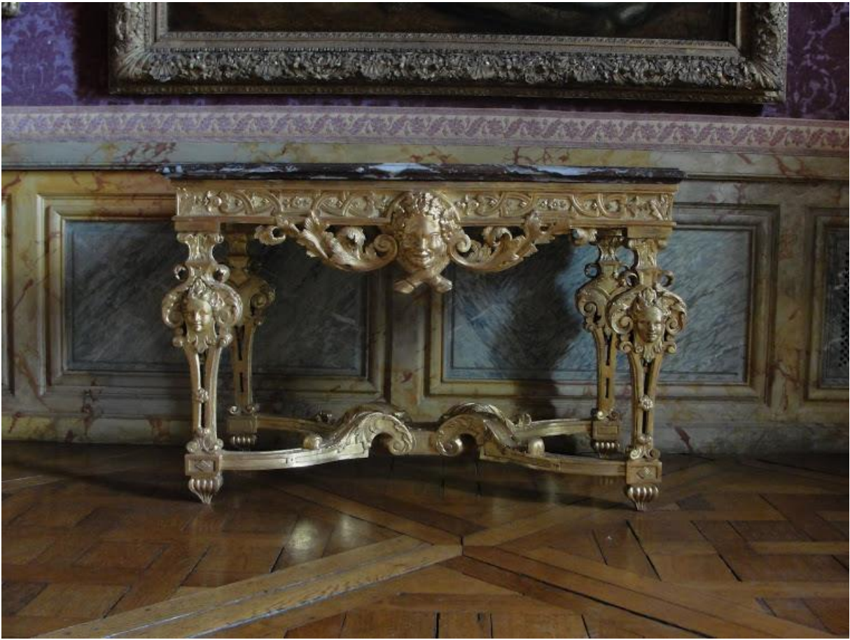
Console bois et marbre devant panneaux moulurés en marbre, château de Versailles.