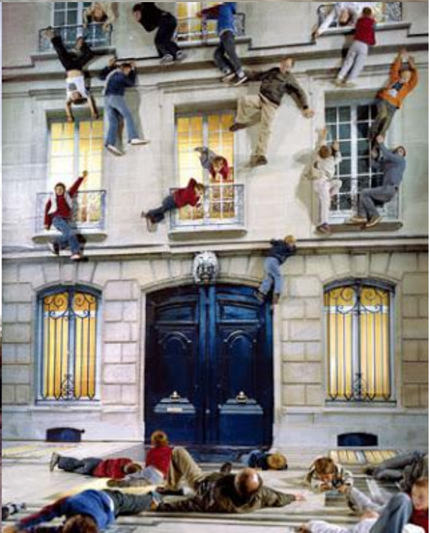
2. Leandro ERLICH, Houses , 2012, au 104, Paris