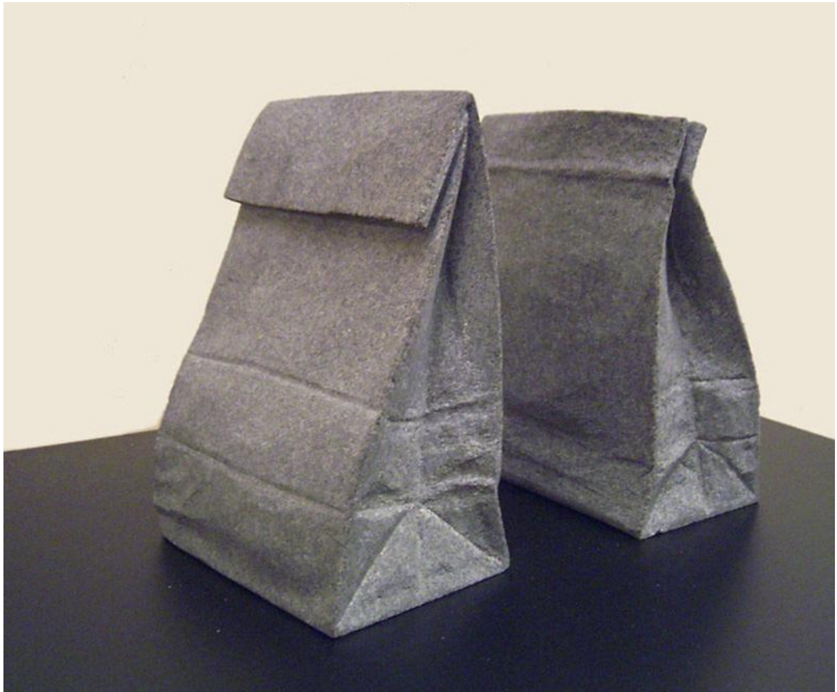
3. Hirotoshi ITOH , objet en pierre, 2012 Échelle 1