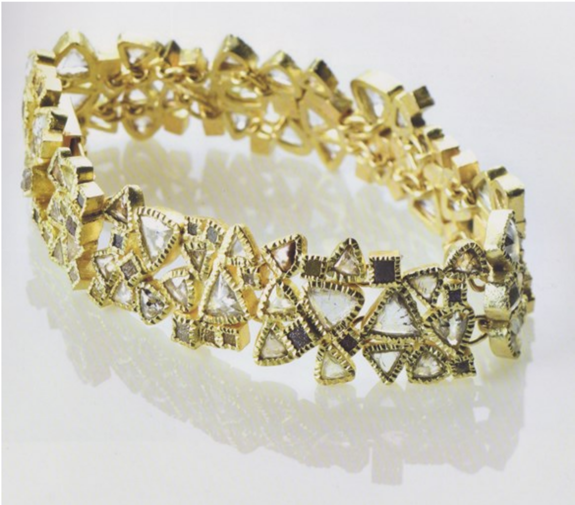
Todd REED , bracelet, production actuelle.