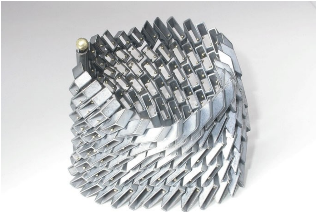
Salima THAKKER , collection Modular (modulaire) , collier et bracelet, production actuelle.