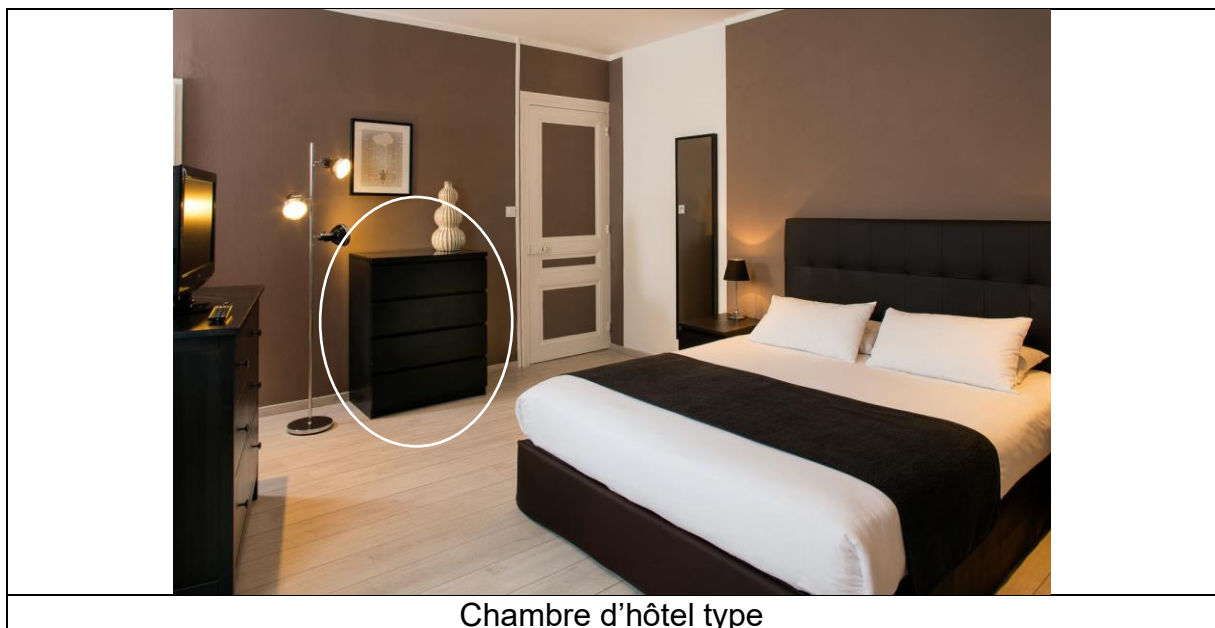
Chambre d'hôtel type