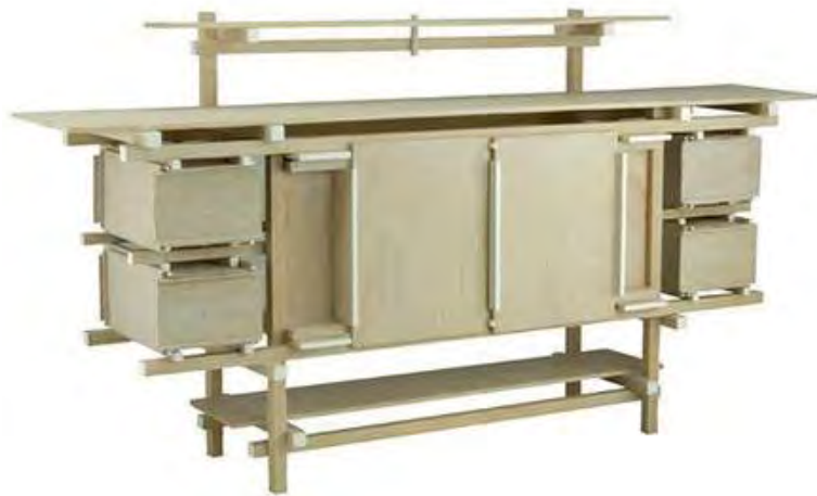
Gerrit RIETVELD, Buffet/Dressoir , 1919. Los Angeles County Museum of Art, Los Angeles, USA.