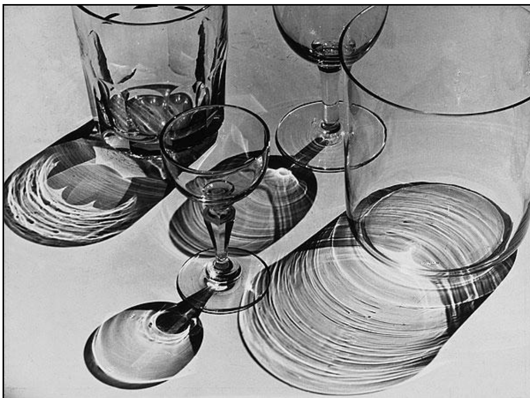
Albert Renger-PATZSCH , photographe allemand (1897-1966) « Verres », vers 1927.