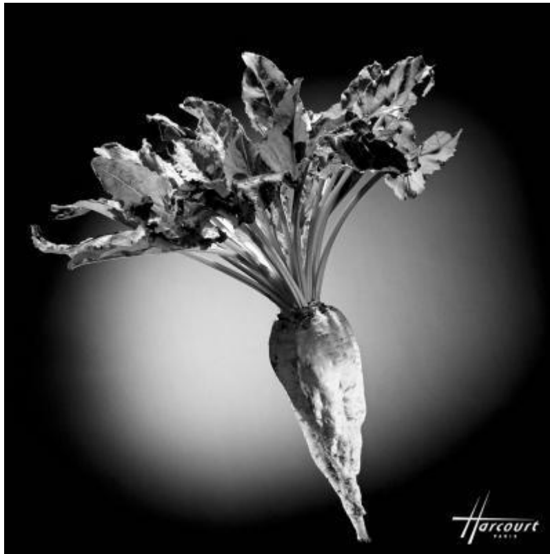
Studio Harcourt, Paris, photographie de navet, 2010.