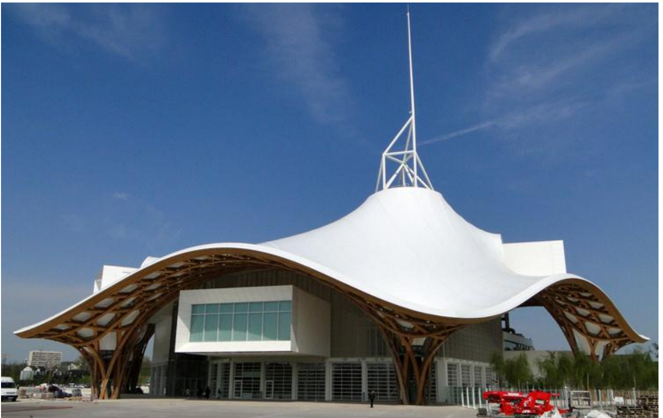
Document 1 - Les architectes Shigeru Ban et Jean de Gastines, le centre Pompidou-Metz, 2010.