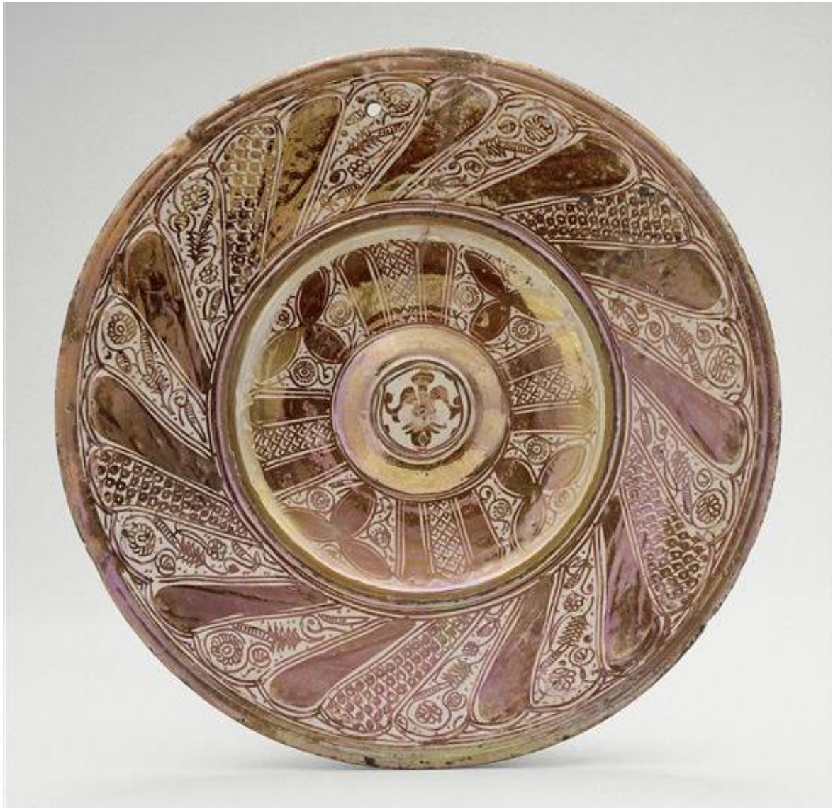
Anonyme , plat hispano-mauresque, faïence lustrée à reflets métalliques , diamètre 50 cm, Manises, Espagne, XVI e siècle.