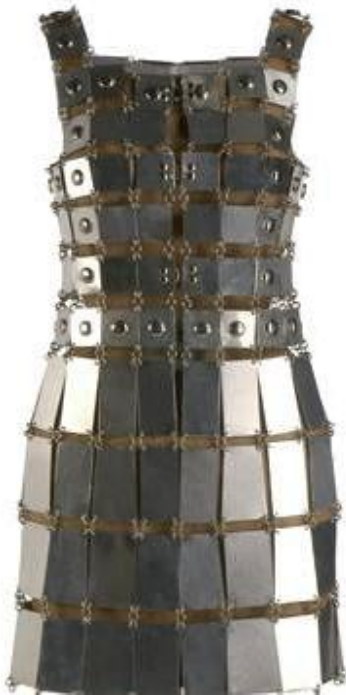
Paco RABANNE , robe mini, plaques d'aluminium , 1969.