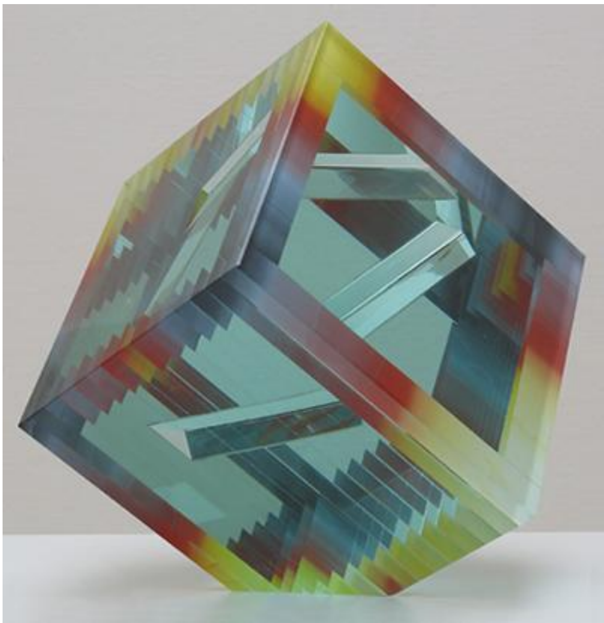
Elias BOHUMIL (Tchéquie), verre plat émaillé et collé, 1986