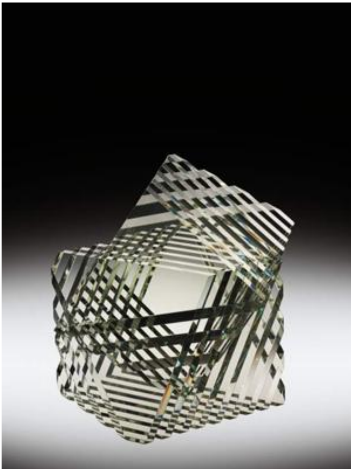
Steven DEVRIES (États-Unis), « Solid 9-110 », verre optique coupé, collé, 1986