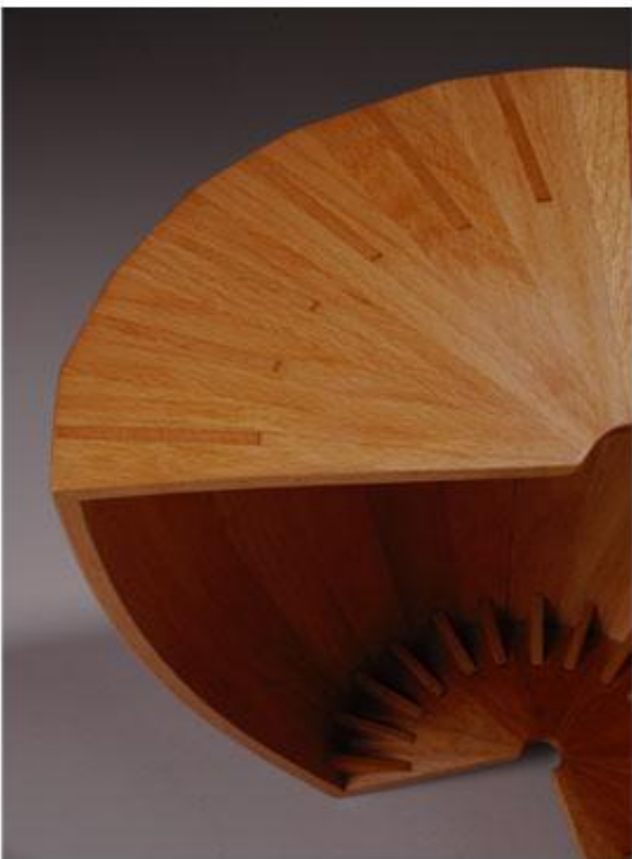
Pliessnig Matthias Designer, Radial , 2003 Hêtre européen. 43cm x 43cm x 41cm Providence, Rhode Island, États Unis.