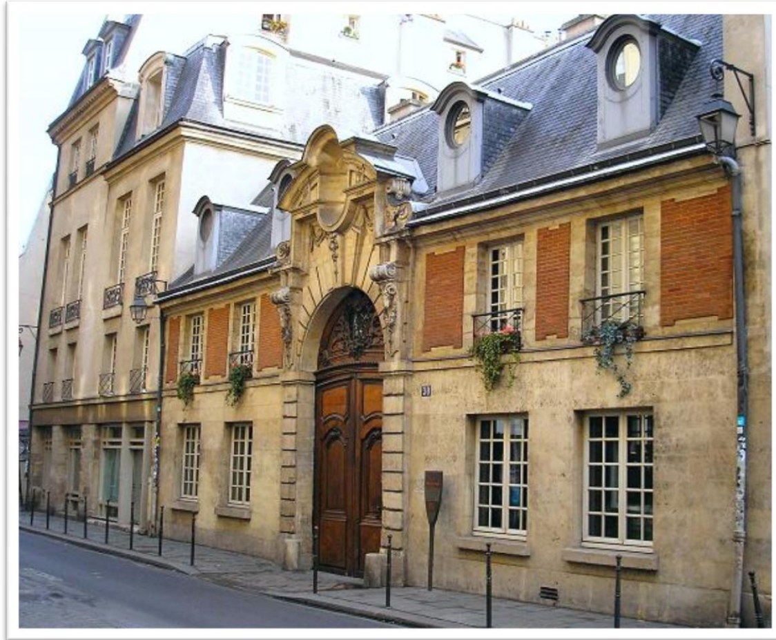
Hôtel particulier d'Alméras, rue de Sévigné à Paris, façade