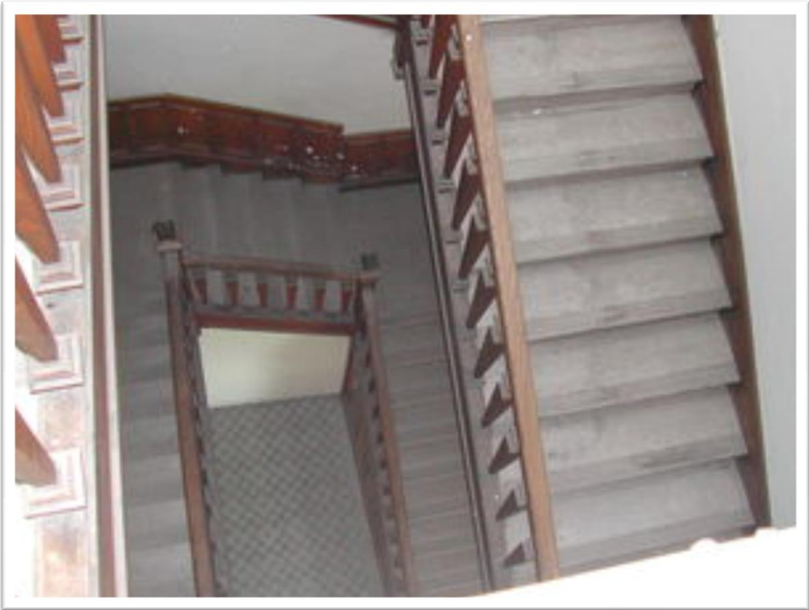
Hôtel particulier d'Alméras, rue de Sévigné à Paris, cage d'escalier