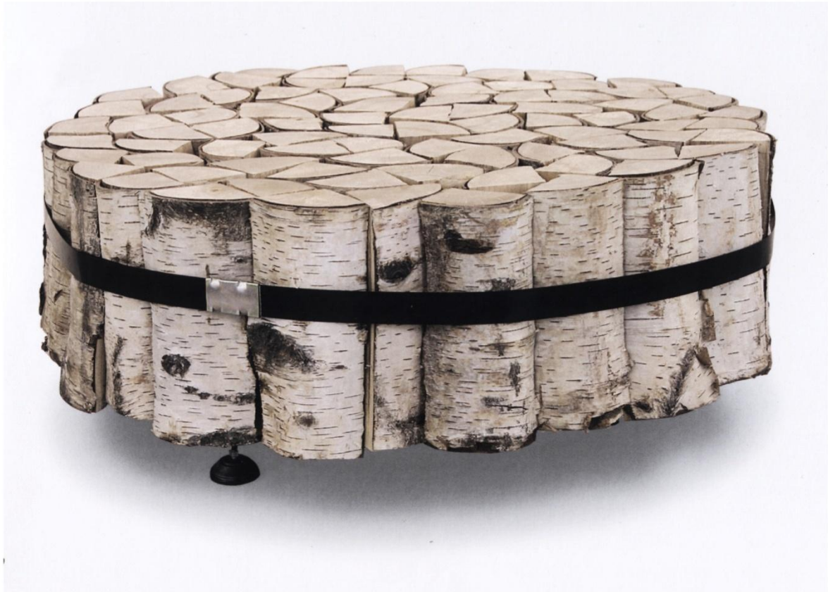
Document 4 : Fredrikson Stallard, Table #1 , 2001.