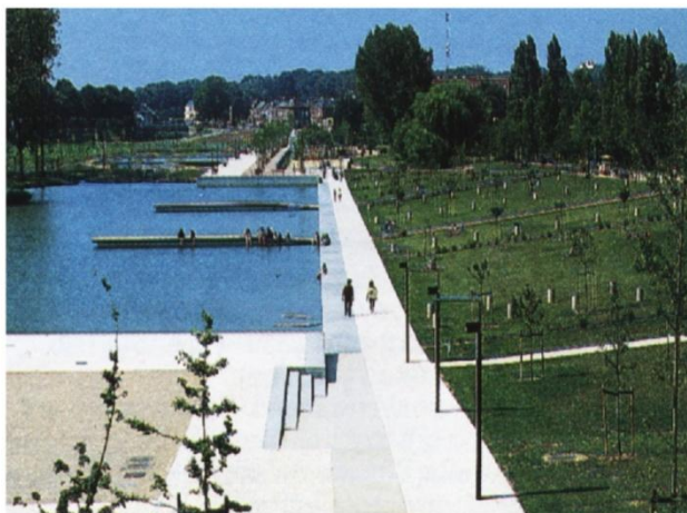
Document 3 J. Osty, Maurer er Orsi, Parc Saint-pierre d'Amiens , 1995.