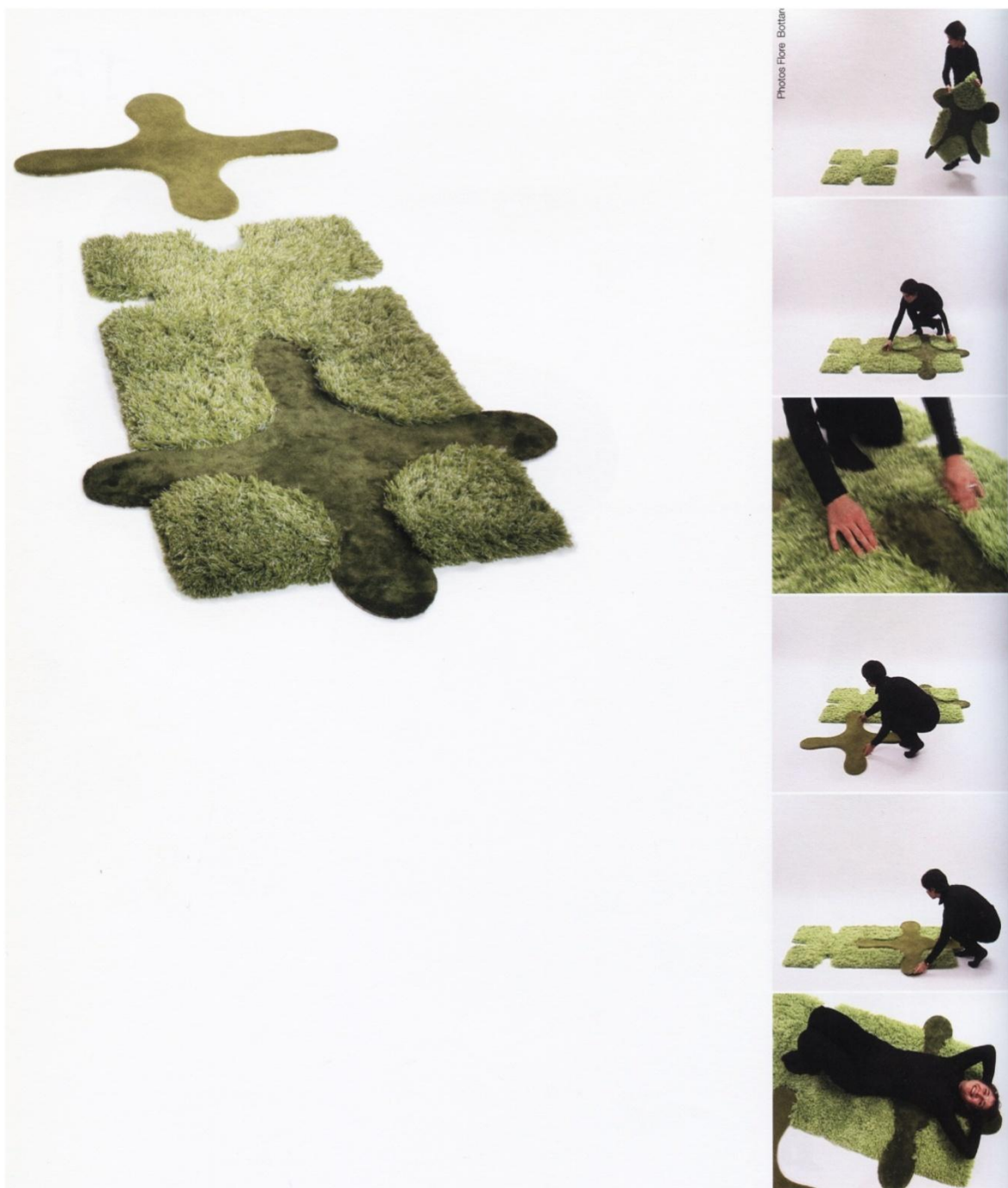
Document 2 : Sonia Déléani, « Colchiques dans les prés » tapis puzzle, 2002