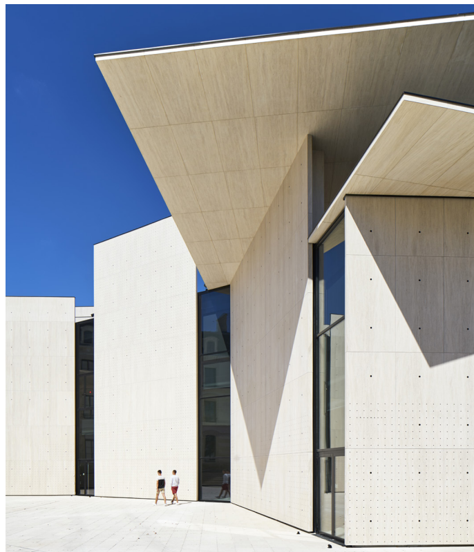
Le Signe, centre national du graphisme, Chaumont

Devenu Biennale et désormais porté par le Signe, ce rendez-vous incontournable réunit tous les artistes et designers graphiques à travers le monde depuis 28 ans.