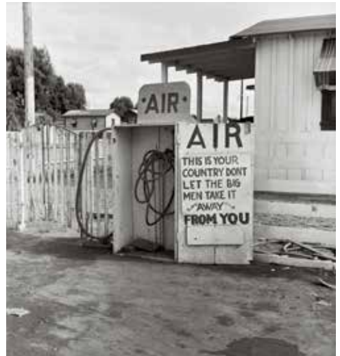
Dorothea Lange, Gas Station, Kern County, California (Lettuce Strike) , 1938 The Oakland Museum of California