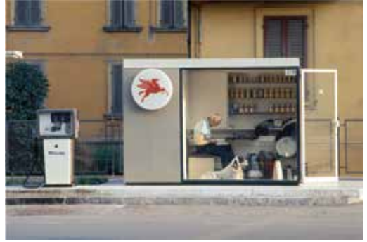
Luigi Ghirri, Modena [Modène], 1973 Collection CSAC, Université de Parme

L'exposition présentée au Jeu de Paume est centrée sur cette première décennie au cours de laquelle le photographe a bâti un corpus d'images en couleur sans équivalent dans l'Europe de l'époque. Son travail culmine alors avec deux temps forts : la publication, en 1978, de Kodachrome , un ouvrage photographique exceptionnel, et une exposition majeure, « Vera fotografia », qui s'est tenue en 1979 à Parme.