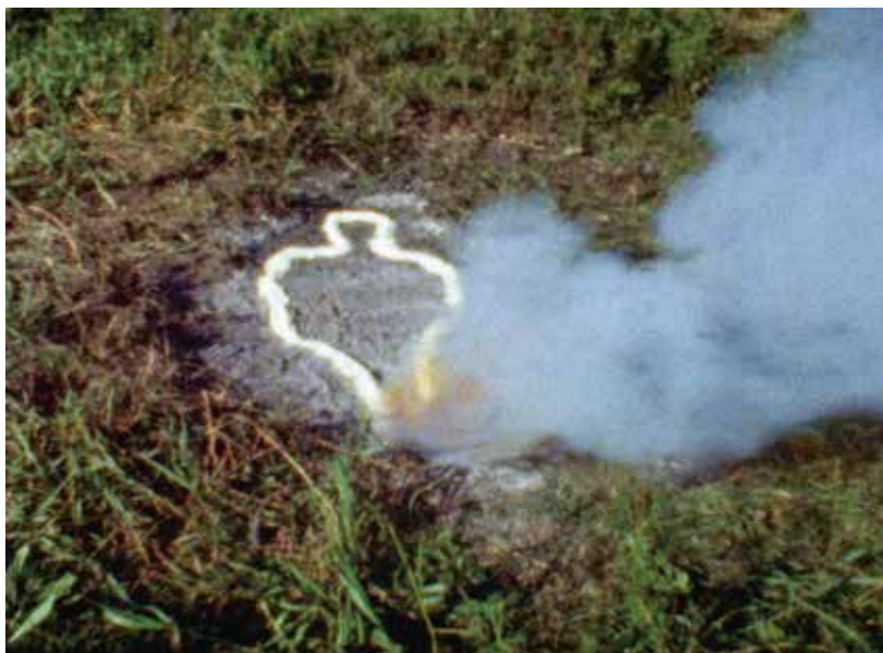
Ana Mendieta, Untitled: Silueta Series , 1978 Galerie Lelong, New York