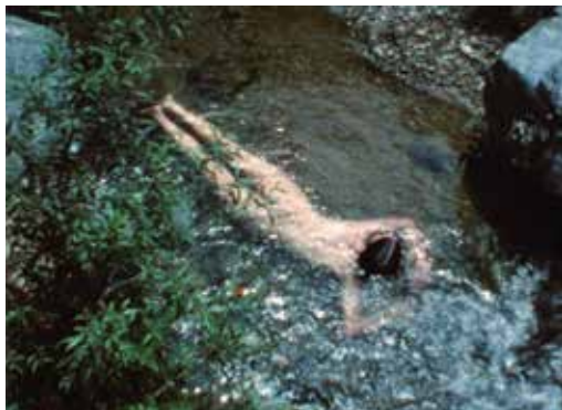
Ana Mendieta, Creek , 1974 Galerie Lelong, New York

De nouveaux documents de recherche permettent maintenant de replacer l'image en mouvement au centre de son œuvre, au travers de thèmes abordés de manière récurrente tels que la nature, la mémoire, l'histoire et le passage du temps, souvent explorés dans la relation du corps et de la terre.