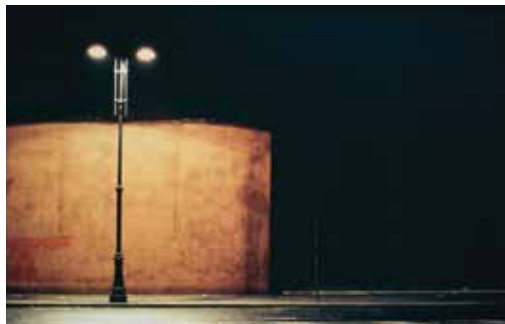
Daniel Boudinet, Réverbère et éclairage nocturne , 1975 Ministère de la Culture / Médiathèque de l'architecture et du patrimoine

Commissaire : Jeroen de Vries Koen Wessing (Amsterdam, 1942-2011), photographe de renommée internationale lié à l'agence de presse Hollandse Hoogte, a également compté parmi les correspondants de l'agence de presse française VIVA