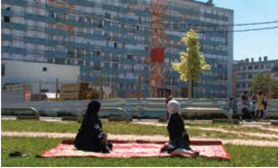
Florence Lazar, Les Bosquets, 2011