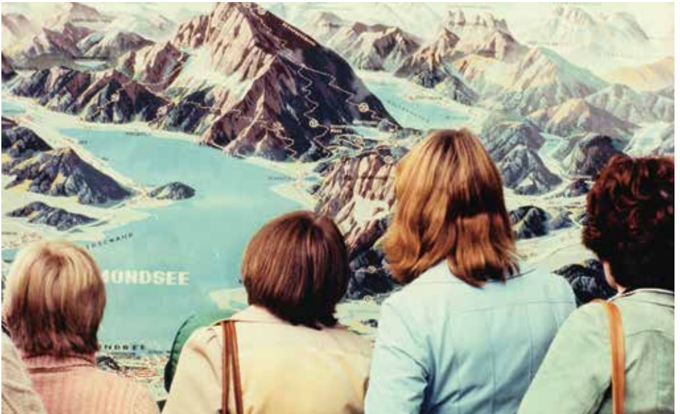
Luigi Ghirri, Salisburgo [Salzbourg], 1977 Collection privée