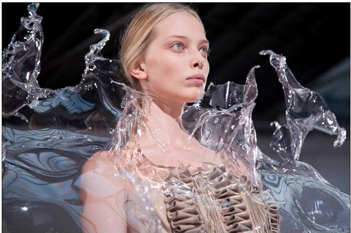
Robe « Splash » de Iris Van Herpen