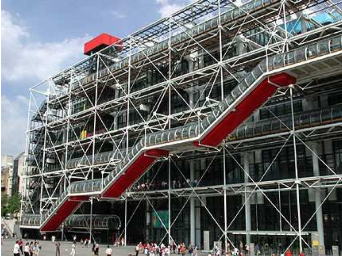
Parvis du bâtiment